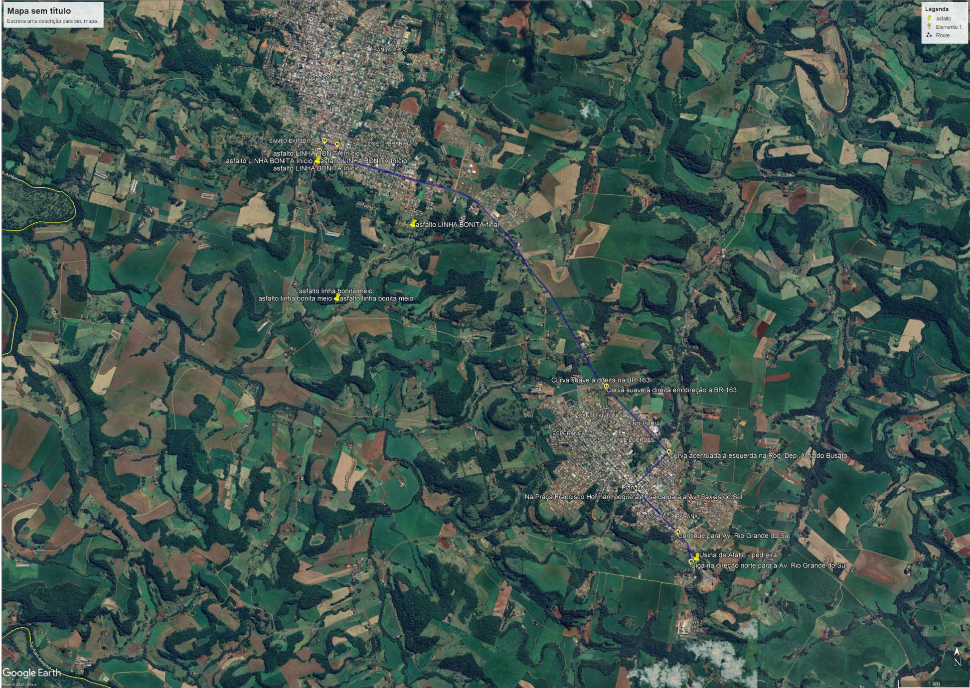
DISTÂNCIA DA PEDREIRA LICENCIADA AO INÍCIO DO TRECHO (10Km) Sem Escala