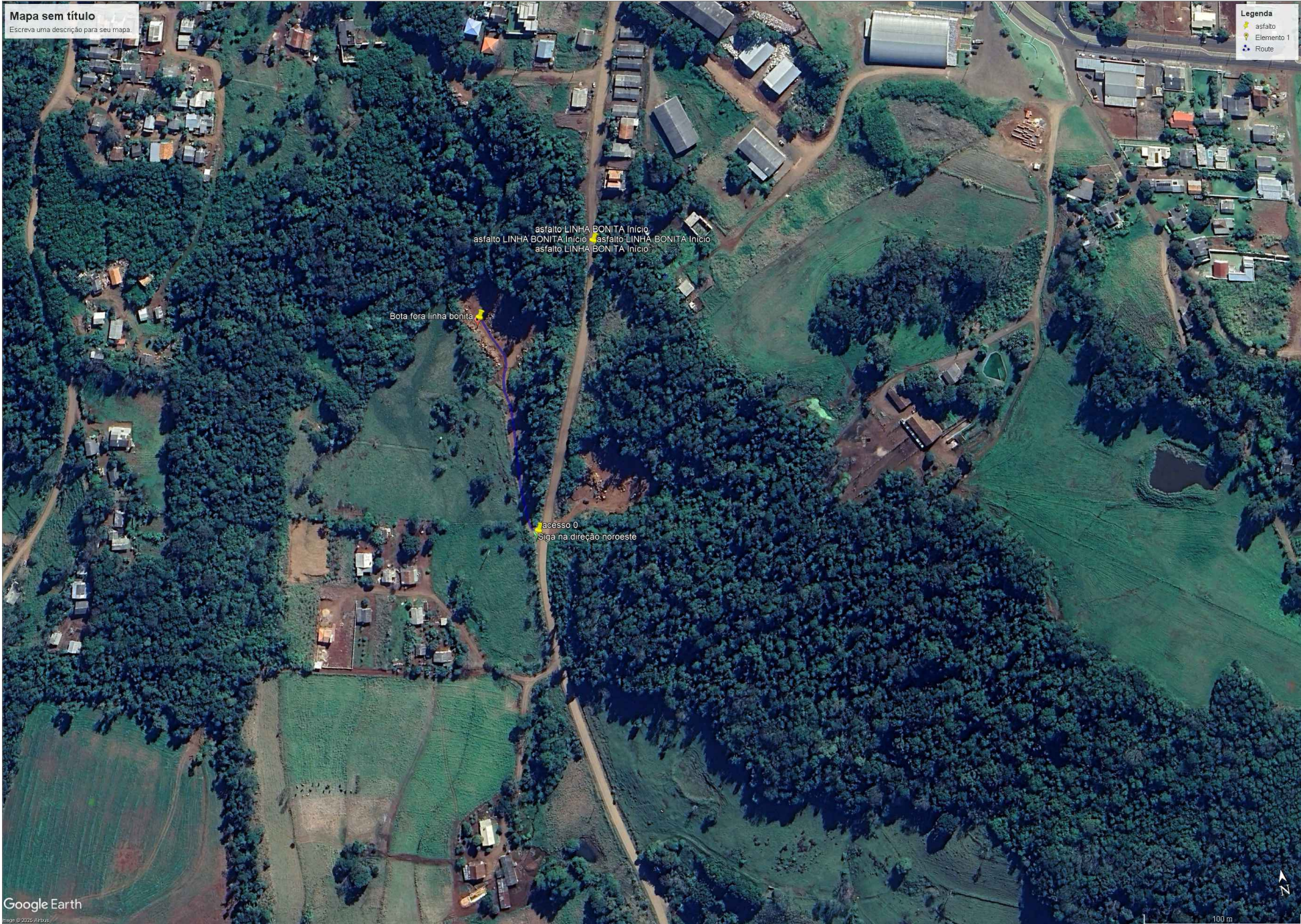
DISTÂNCIA DO BOTA FORA (160,00m) Sem Escala